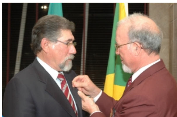
Figueira da Foz

RC Figueira da Foz: O Rotary Club da Figueira da Foz tem desempenhado importante papel social. Presentemente, presta apoio a 21 famílias carenciadas, escolhidas através da Segurança Social de três freguesias diferentes do concelho. E têm também colaborado na recolha de bens nas grandes superfícies, em conjunto com o Banco Alimentar contra a Fome.