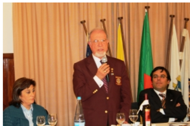
Ponte de Lima