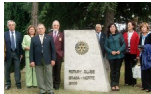
Braga - Norte

RC Braga-Norte: “(...) protocolos com o Banco Mundial contra a Fome, recolhem e recuperam mobiliário velho e electrodomésticos, encaminhando para quem mais necessita”.