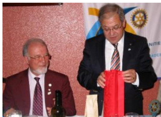
Vila Nova de Foz Côa

RC Amarante: “O Governador registou com muito agrado que pudesse visitar (...) um passado muito rico de história, projectos e realizações do Clube”.