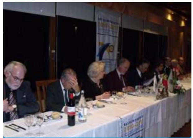
Póvoa de Varzim

Seguiu-se a deslocação ao centro de saúde de Ponte da Barca, que tem uma parceria com Rotary Club. O centro de saúde administra equipamento e ajudas técnicas a pessoas com deficiência. Entre os equipamentos, geridos com informação mensal, contam-se 26 cadeiras de rodas, 8 camas articuladas, 8 colchões normais e 2 colchões anti-escara. Para o Governador, estes valores são notáveis, tendo em conta que a comunidade de Ponte da Barca é pequena. Neste momento estão a negociar de modo a que surjam outras parcerias, nomeadamente com a Câmara Municipal,