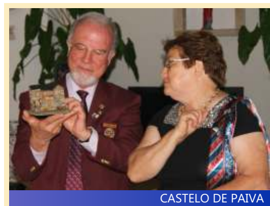
CASTELO DE PAIVA

Na Carta Mensal de Setembro, daremos conta da Visita Oficial do Governador ao Rotary Club de Valpaços.