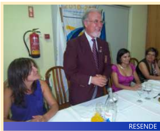
RC Resende: Aceitação do Clube na comunidade cresce graças a parceria com instituições, designadamente com a Misericórdia local

clubes do Distrito, numa agradável surpresa, demonstrando todo o apoio ao clube de Castelo de Paiva numa nova dinamização que está a precisar.