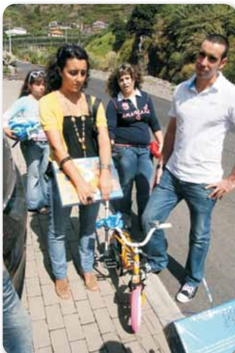
Distribuição de prendas no Centro de Acolhimento D. Gracinda Tito pelo RTC Funchal-Uma