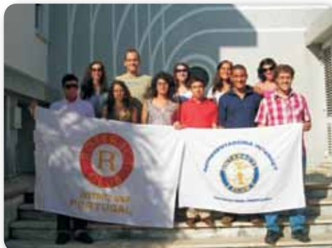
Interact e Rotaract Entrancamento debate Educação Sexual