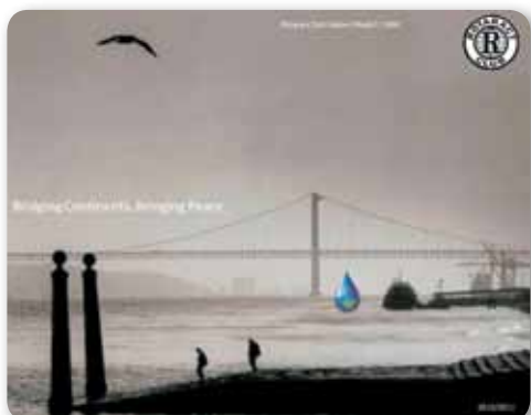
Building Continents, Building Peace

Rotários Portugueses, O mais importante a pedir aos Clubs Rotary é a sua abertura à comunidade, especialmente aos jovens. Com isso apresento novamente os "Estágios por um dia".