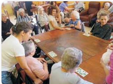
Interact Club Castelo Branco visita Lar Carlos d'Abrunhosa