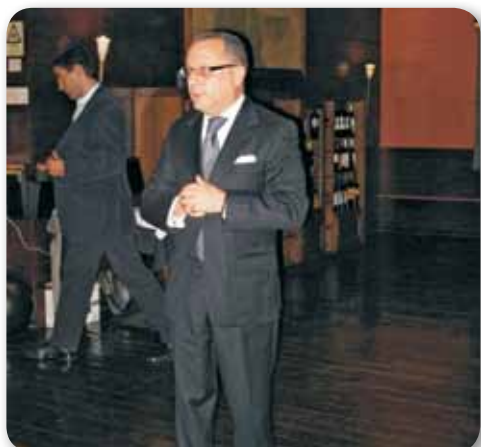
Noite Argentina pelo RTC Lisboa-Norte