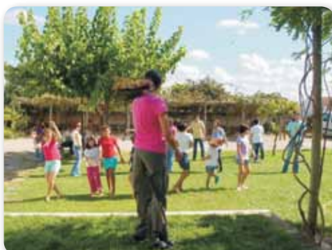
"Foste dançar com o Rotaract?" em Castelo Branco