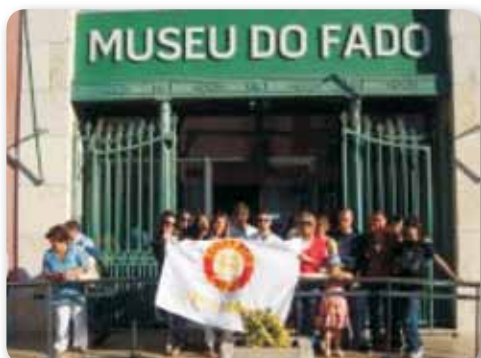
Rentrée no Museu do Fado pelo Rotaract Club Lisboa-Benfica